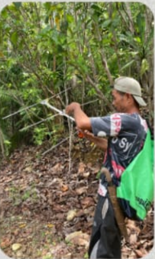
Animal GPS Tracking