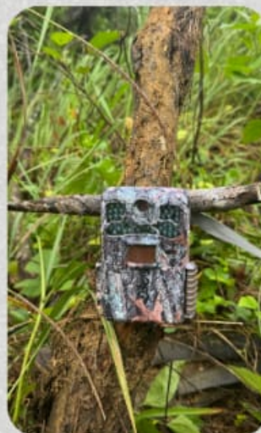
Camera Trap Setting